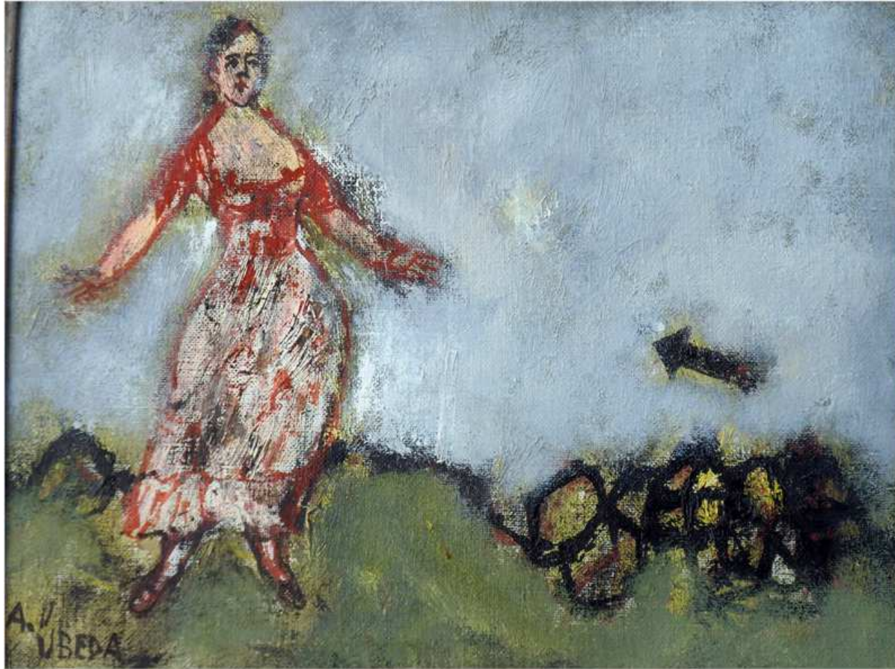
"CERCA DE UNA SIESTA"