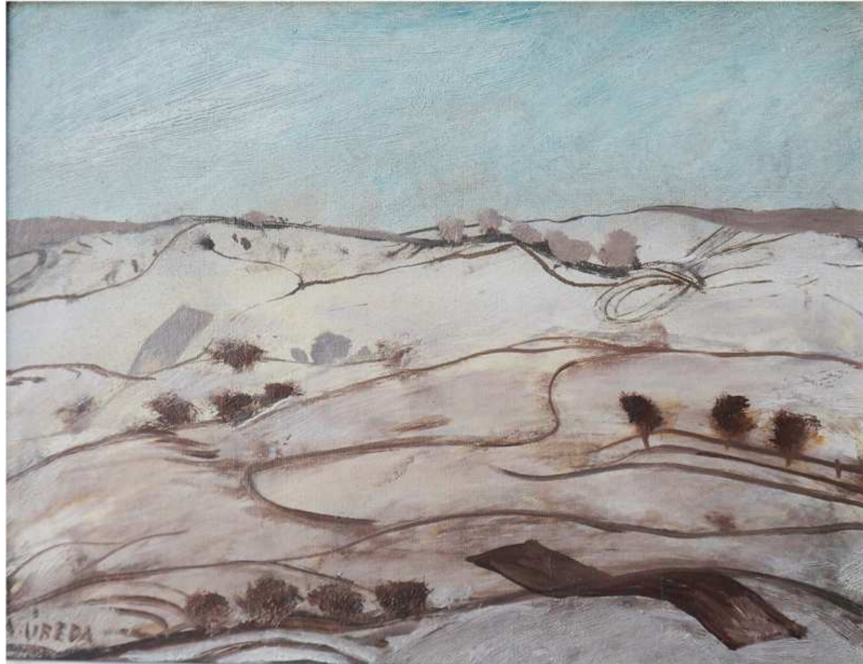
"VILLA YERMO, BURGOS"